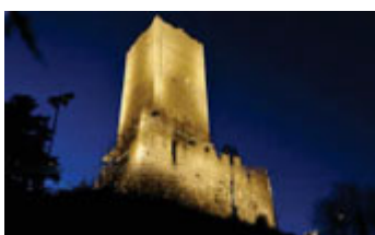
Castello Baradello Veduta notturna