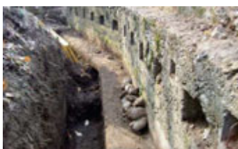
Trincee Linea Cadorna zona Fortino